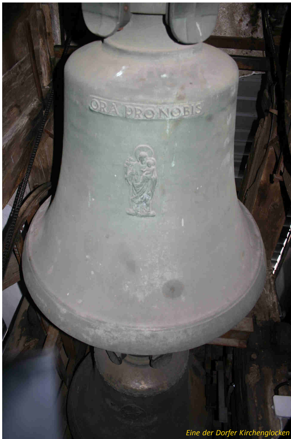
Eine der Dorfer Kirchenglocken